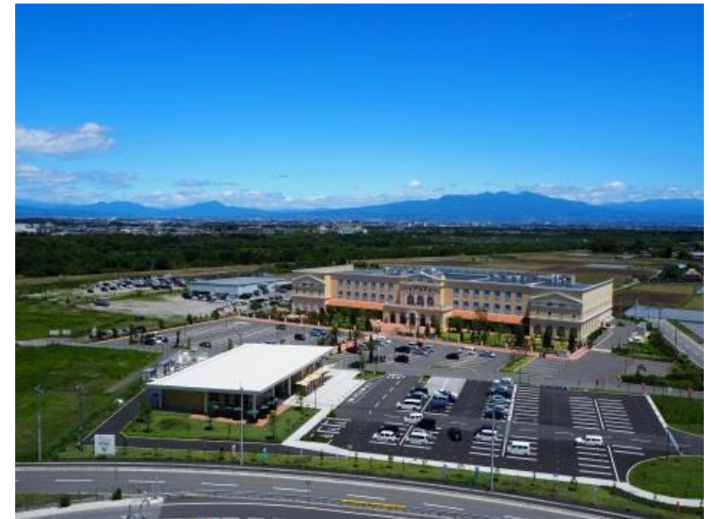
平成29年12月、関越自動車道 上里スマートインターチェンジが開通し、発展が期待される上里サービスエリア周辺地区