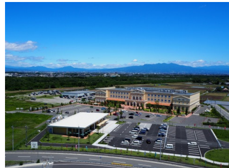
平成29年12月、関越自動車道 上里スマートインターチェンジが開通し、発展が期待される上里サービスエリア周辺地区