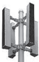
「防災行政無線」 新設：縦型スリムスピーカー

町民の皆さまの一日の締めくくりになるかわかりませんが、心の安らぎのひと時になればと思っております。