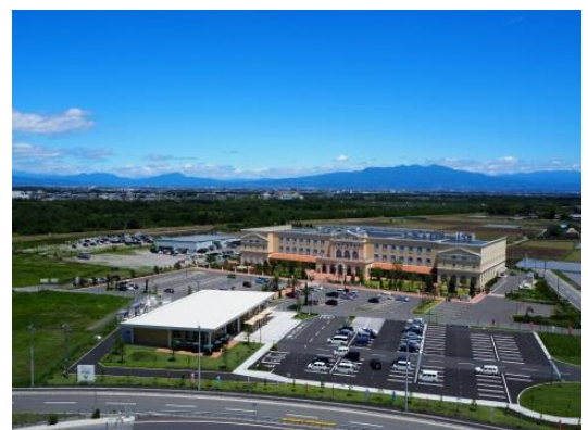
平成29年12月、関越自動車道 上里スマートインターチェンジが開通し、発展が期待される上里サービスエリア周辺地区