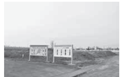
上里S A周辺地区の多目的広場整備予定地