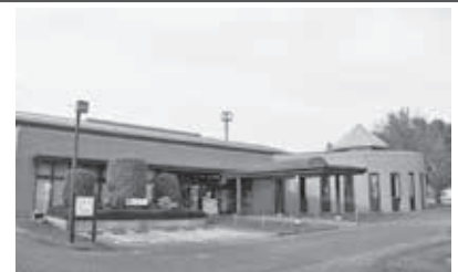
照明改修工事を行う上里町立図書館