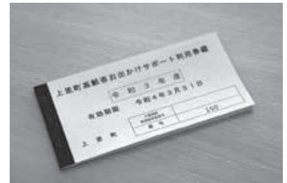
高齢者お出かけサポート利用券