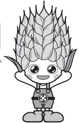
『けんこう大使こむぎっち』