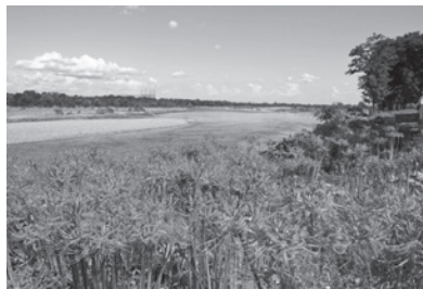
▲見ごろの時期のヒガンバナの様子