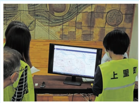
▲オートコールソリューション ビジネスチャットの実証実験