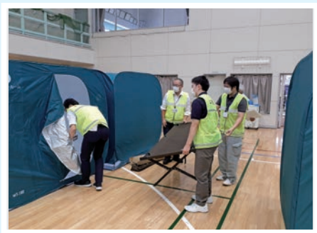
▲パーティション設営訓練の様子

また、災害発生時における要配慮者への避難情報等の伝達や非接触での避難確認に用いられる、東日本電信電話株式会社埼玉支店（NTT東日本）が開発している「オートコールソリューション」や「ビジネスチャット」を活用した実証実験を併せて実施しました。