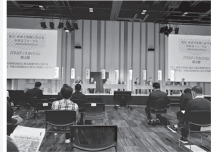
▲パネルディスカッションの様子