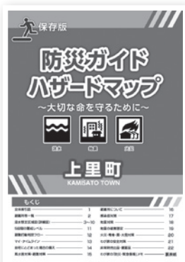
▲防災ガイド・ハザードマップ