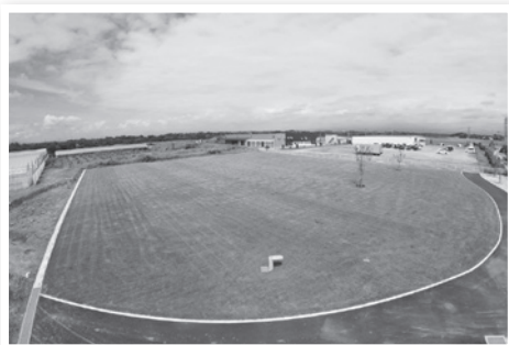
▲このはな芝生広場