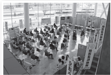
▲ワクチン接種予約サポート時の様子