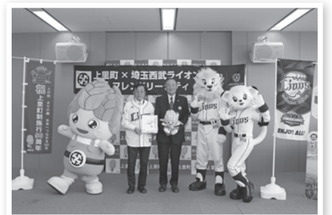
▲(株)西武ライオンズとの協定締結式