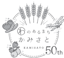
▲町制50周年記念ロゴマーク