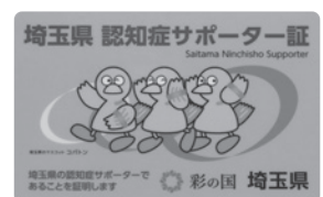
▲修了者に配布されるサポーター証