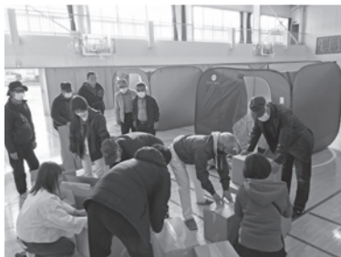
▲12月5日(日)、神保原町一丁目自主防災会 (23名参加)