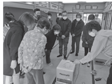
▲12月12日(日)、大御堂自主防災会 (17名参加)