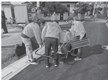
▲11月21日(日)、三軒自主防災会 (約40名参加)

町内では各地域の自主防災組織が、避難訓練や避難所開設訓練、防災講習会など、地域の実情に応じた活動をしています。自主防災組織は、住民が地域の防災活動を行うため、町内の各行政区等で自主的に組織された団体です。どなたでも加入・参加できますので、ぜひご参加いただき、共助の力を高める活動にご協力ください。