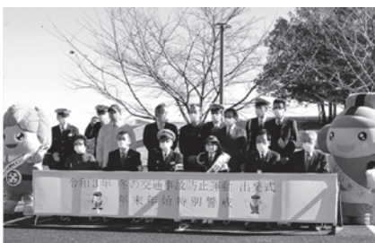
▲冬の交通事故防止運動・年末年始特別警戒出発式の様子

町では引き続き、交通安全広報大使や交通指導員の皆さまなど、町内で献身的に活動いただいている方々と連携し、切れ目のない交通安全啓発活動を実施していきますので、町民の皆さまにおかれましても、交通事故防止にご協力を宜しくお願ひ申し上げます。