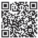
▲上里町早期不妊検査 不育症検査費助成事業

※埼玉県不妊治療費助成事業を申請する予定の方は、先に県助成金の申請をし、治療の終期の年度末が埼玉県不妊治療費助成金支給決定通知書の施行日から60日を経過した日のどちらか遅い日まで申請可能となります。