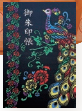
御朱印帳 初穂料 1,500円