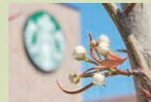
春には可憐な白い花を咲かすシンボルツリー(梨の木)

1本のメールをきっかけに2021(令和3)年から始動した、上里町でのこのコミュニティコネクション活動。5年目の節目となる2026(令和8)年、この「つながり」は、新たな物語を紡ぎはじめました。これまで上里サービスエリア(上り線)店を中心に展開してきた地域とのつながりをより広める場所となる「ユニクス上里店」が1月13日にオープン。店舗の象徴となるシンボルツリーには、町の特産であり活動の原点でもある梨を採用しました。