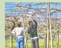
受粉作業を体験するパートナー

「地域のために何かアクションしたい」。上里町内にあるスターバックスのパートナー(従業員)のそんな想いからはじまった、地域とのつながりを築くコミュニティコネクション活動。スターバックスでは全国それぞれの地域で、地域のニーズに合わせたコミュニティコネクション活動を実施しています。上里町では、県内有数の梨産地を未来へ繋げるためにスターバックスのパートナーたちが年間を通して梨園を訪れ、枝づくりから収穫までを体験、店舗内のコミュニティボードなどで写真やイラストを交えながら発信しています。