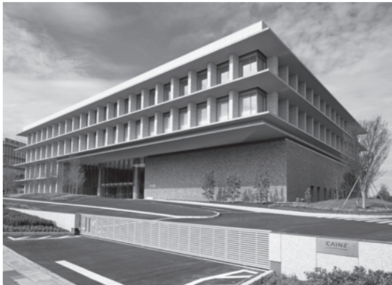
▲株式会社カインズ本部

29都道府県に 239店舗を展開するホームセンターです。カインズの店舗やそこで働くメンバー(従業員)がハブとなり、それぞれの地域のお困りごとや関心に耳を傾けながら、一人ひとりが主役になれる「まち」を実現することを目指した“くみまち構想”に基づき、よりよいくらしに貢献します。