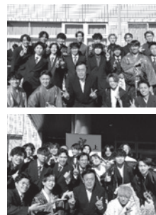
▲二十歳の集いの皆さんと

元日夕刻に発生した能登半島地震被害への支援のため、さっそく5日から募金箱を役場町民ホールに設置したところ、既に大勢の方からご寄附をいただきました。また、被災地支援として、15日には埼玉県職員と一緒に町職員を1名、七尾市へ1週間派遣しております。さらに、現地の厳しい水道事情を踏まえ、給水車1台と職員2名の派遣準備中です(1月15日現在)。被災地の一時も早い復興を願っていますが、復興への支援は長期にわたりますので、町として全力で支援していきたいと思っております。