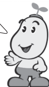
国民マスコット 健康まるくん