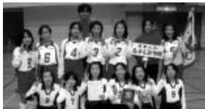
Bブロック優勝 賀美小JVC