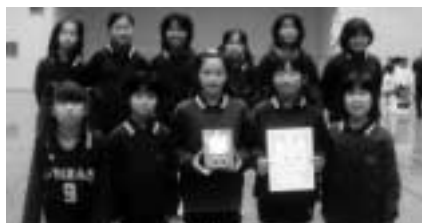
Cブロック優勝 七本木JVC