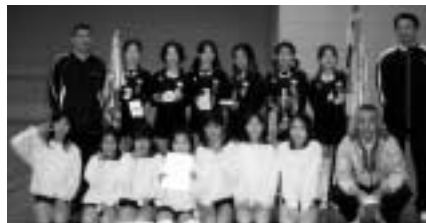
Aブロック優勝 上里東JVC