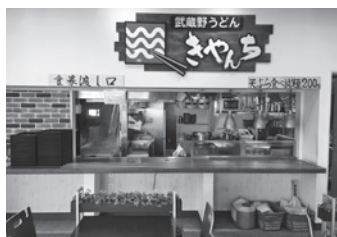
▲「武蔵野うどん きやんち」