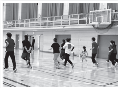
▲スポーツイベント2025 「体力・運動能力テスト」