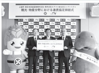
▲NEXCO東日本との連携協定締結