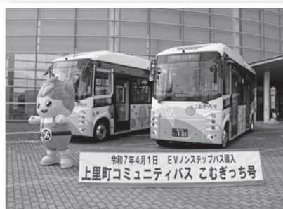
▲上里町コミュニティバス「こむぎっち号」EVノンステップバス