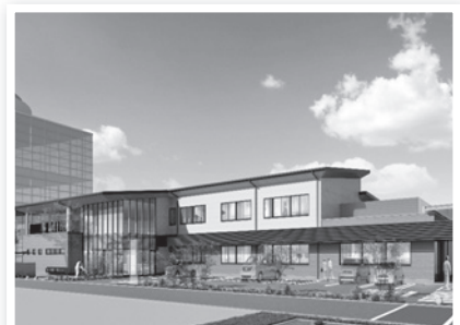
▲「こむぎっちテラス」イメージ図