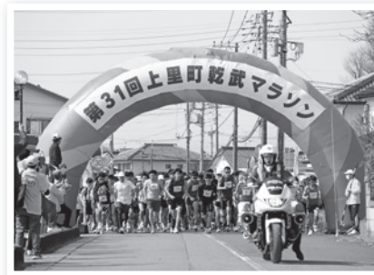
▲第31回上里町乾武マラソン大会