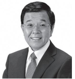
上里町長 山下 博一