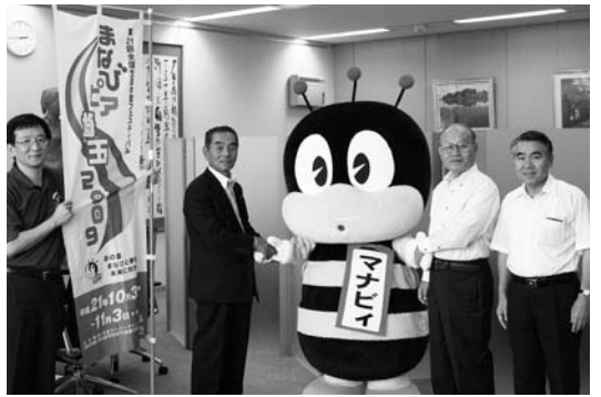
町長と握手をするマナビィ

開催期間…10月30日(金)～11月3日(火)の5日間 主会場…さいたまスーパーアリーナ・けやき広場