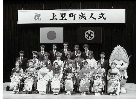
成人式実行委員の皆さん

1月8日(日)、ワープ上里で第58回上里町成人式が開催され、398名が新たに大人の仲間入りをしました。この式典は、成人式実行委員が企画・運営に携わり、当日も受付や司会を担当し、成人者自らの手で式典を盛り上げました。参加した新成人の皆さんは、友人や恩師との久しぶりの再会を喜びました。