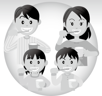
平成24年度歯周疾患検診実施歯科医院一覧