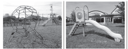
遊具の更新工事を行う長幡児童公園