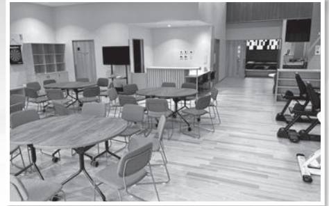
いきいきラウンジ（老人福祉センター）