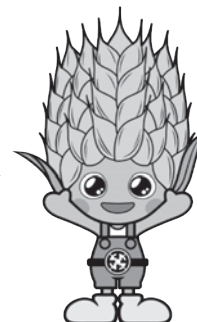
『けんこう大使こむぎっち』