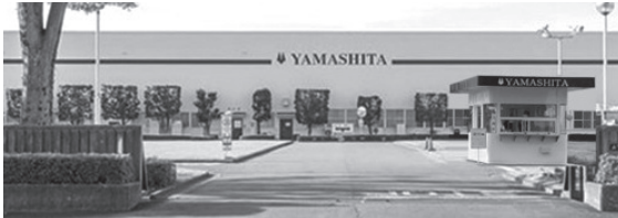
▲山下ゴム株式会社埼玉工場

国内2工場(埼玉、三重)と海外7拠点(アメリカ、メキシコ、中国、タイ、インド、インドネシア、ベトナム)に展開するグローバル企業で、今回紹介する埼玉工場は、児玉工業団地にあり、主にホンダ様向けの防振ゴム部品を中心に製造して、国内、海外へ出荷しています。