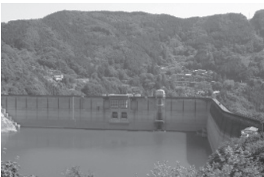
▲下久保ダムの水位の様子（5月19日現在）

ここ数年は毎年、過去最高に暑い夏となっています。今年の夏も猛暑や酷暑の日が続くことが予想され、農地が乾燥して必要となる水の量も多くなるはずです。改めて節水にご協力をお願いいたします。