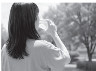
こまめな水分補給を心掛けましょう!

こちらの事業では、ウォーキングの歩数などで健幸ポイントが貯まる仕組みとなっております。参加者