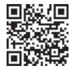
▲オンデマンド講座専用 申込二次元コード