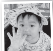
蝦夷森獅琉くん (3歳・下久城)