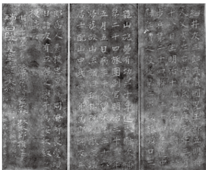
鷗外が記した墓石の文章

生得られないだろう。心細いような、つまらないような」とあつて、当時の鬼城の気持ちがつづられていて、二人の友情の深さがわかるんだよ。