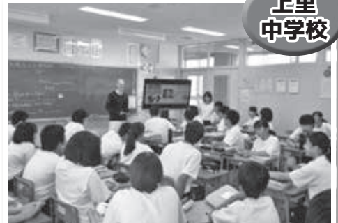
ALTや映像を活用した英語の授業風景

上里中学校では、全学級に週1時間ALTを活用した英語の授業を行っています。他国の文化に触れ合い、英語で楽しみながらコミュニケーションをとる機会を増やしています。また、映像や教具を使用することで視覚的に訴え、興味が湧くような工夫も行っています。机配置はコの字隊形で行い、毎時間ペアや3～4人のグループ活動を行う中で、主体的・対話的で深い学びの実現に努めています。