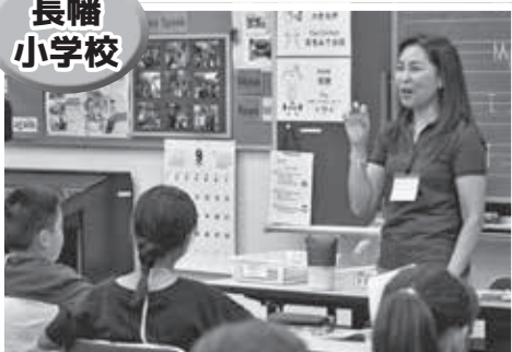
レイヤ先生との授業