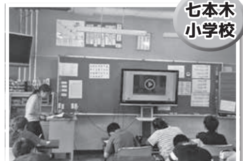
大型電子黒板を使用した授業風景