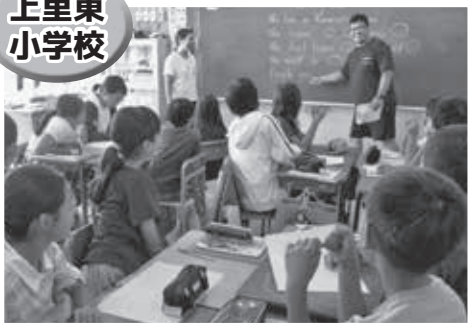
担任とALTによる外国語の授業