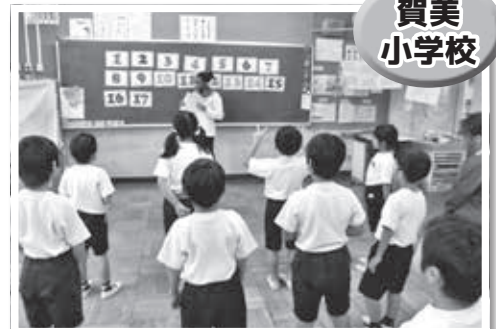
数のカウント How many ~?