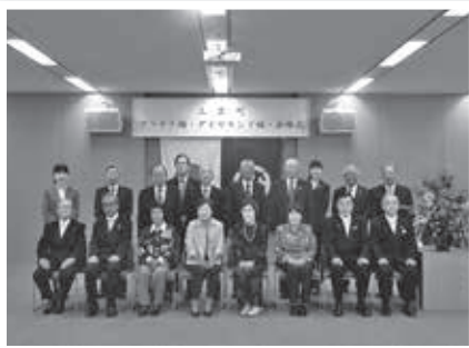
七本木小学校地域②