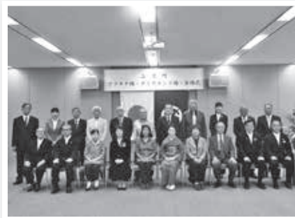
上里東小学校地域