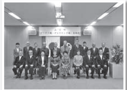
神保原小学校地域