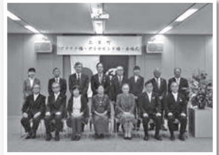
七本木小学校地域①