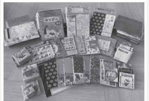
▲寄付していただいた折り紙