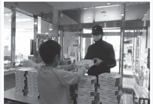
▲「無料ピザで地域支援」の様子

また令和3年4月には、町内ご在住の方から空の杜保育園へ、折り紙をいただきました。有効に利用させていただきました。