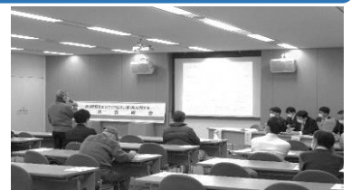
▲「住民説明会」の様子

□パブリックコメント・住民説明会でのご意見・ご質問等については、上里町ホームページにて掲載しております。